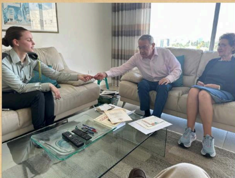
קבלת החפצים מקצינת הנפגעים