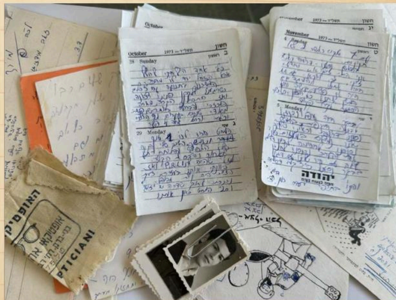
קטעי הזימון וחפצים נוספים

בין היתר הוא מציין את קרב החווה הסינית: "טנק אחד הצלחתי לחלץ, אבל הזחל ירד לו מהור (הגלגל המניע שמעל הזחל - ח"ה). המשכנו בתנועה עם 5 כלים, כשהגענו ללקקו פנינו צפונה ואז התחיל הקרב. מארב האכזרי והברוטלי ביותר שנפגשתי מעודי. טנקים בוערים מ-2 הצדדים, וכולם יורים אחד על השני"