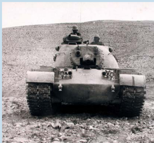
טנק מגוז אם-48-א-1 מהראשונים בצה"ל